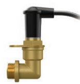
Электрод Устанавливается на заводе